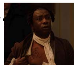
Les images du film