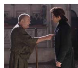
Les images du film